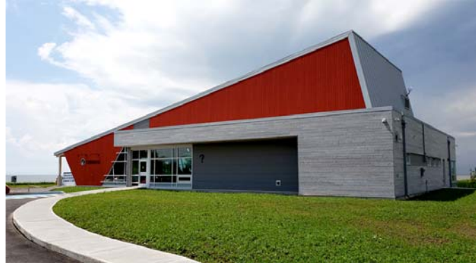
Centre d'information touristique du Kamouraska (revêtement: Cape Code)