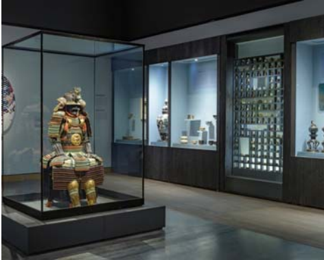
Musée des beaux-arts de Montréal (revêtement: Yakisugi)