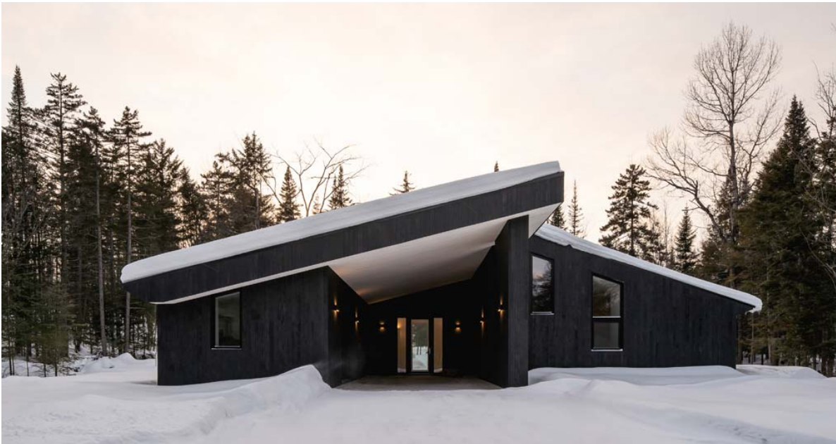
Atelier C: atteindre le plus haut niveau de certification LEED (revêtement extérieur : Jaguar)

Si votre décision n'est basée que sur le prix initial d'achat, ne perdez pas votre temps à poursuivre cette lecture. Par contre si vous souhaitez encore être fier de votre achat dans 10 ans et avoir économisé des sous en bout de ligne alors voici nos suggestions :