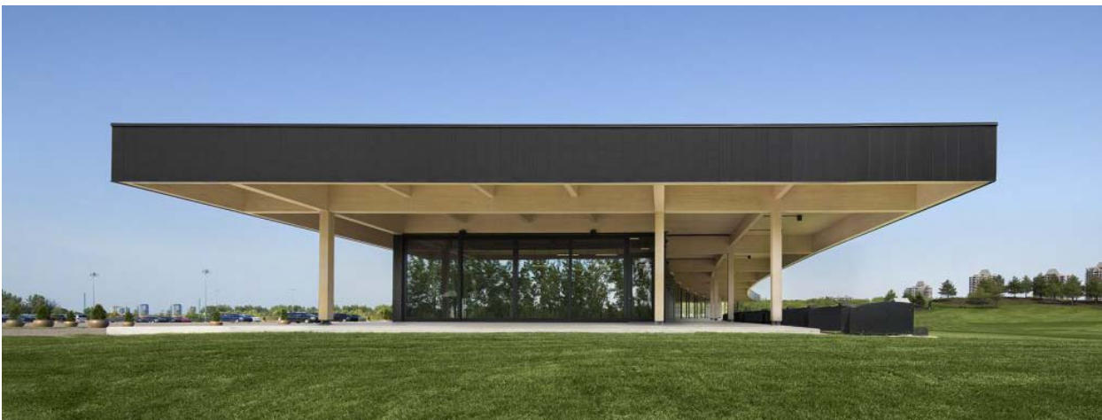
Golf Exécutif Montréal (revêtement: Jaguar) - Prix d'excellence Cécobois 2019

La qualité du produit et le sérieux d'une entreprise sont certainement une clé de voute dans cette démarche. Il ne vous est pas nécessairement possible de visiter l'entreprise en question ou de parler aux précédents clients. Nous vous invitons à regarder certaines de nos réalisations sur notre site web ( www.espace-bois.ca ) et vous verrez que nos produits ont été primés (Golf Exécutif de Montréal – Prix d'excellence Cécobois 2019) et sélectionnés pour des événements à très haute visibilité comme au Musée des beaux-arts de Montréal. Chez Espace-Bois / Cayaki Inc. nous avons la qualité de notre produit et le sérieux de notre service à cœur.